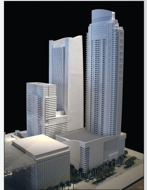
Realization Group은 ZPrinter 310 Plus를 이용하여 기존 건축 모델링 방식에 들어가는 시간과 비용의 1/4로 이28인치 높이의 마이애미 'Met' 모형을 제작했습니다.

“중요한 것은 속도입니다. 오늘 모형 주문을 받아 내일 전달할 수 있게 되었습니다. 또 하나의 중요한 요소는비용입니다. ... 광조형 기술이나 레이저 커팅의 1/4 비용으로 모형을 제작할 수 있습니다..”